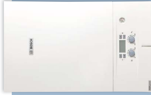
Довговічний, ефективний, за приємною ціною – Condens 2000 W

Condens 2000 W інсталиється за декілька простих операцій – так Ви заощаджуєте Ваш багатогодинний час. Завдяки системі вертикальних кріплень Вам більше не потрібна монтажна панель для приєднання трубопроводів. Технічне обслуговування також виконується з легкістю завдяки зрозумілим стандартним кодам помилок та інтуїтивно зрозумілій філософії користування за принципом «поверни-та-натисни». Само собою зрозуміло, що всі важливі компоненти котла без проблем доступні для технічного обслуговування з фронтального боку приладу.